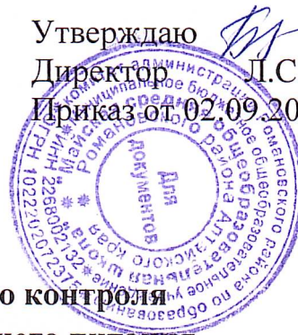
График проведения родительского контроля качества организации горячего питания на 2024-2025 учебный год в МБОУ «Майская СОШ»